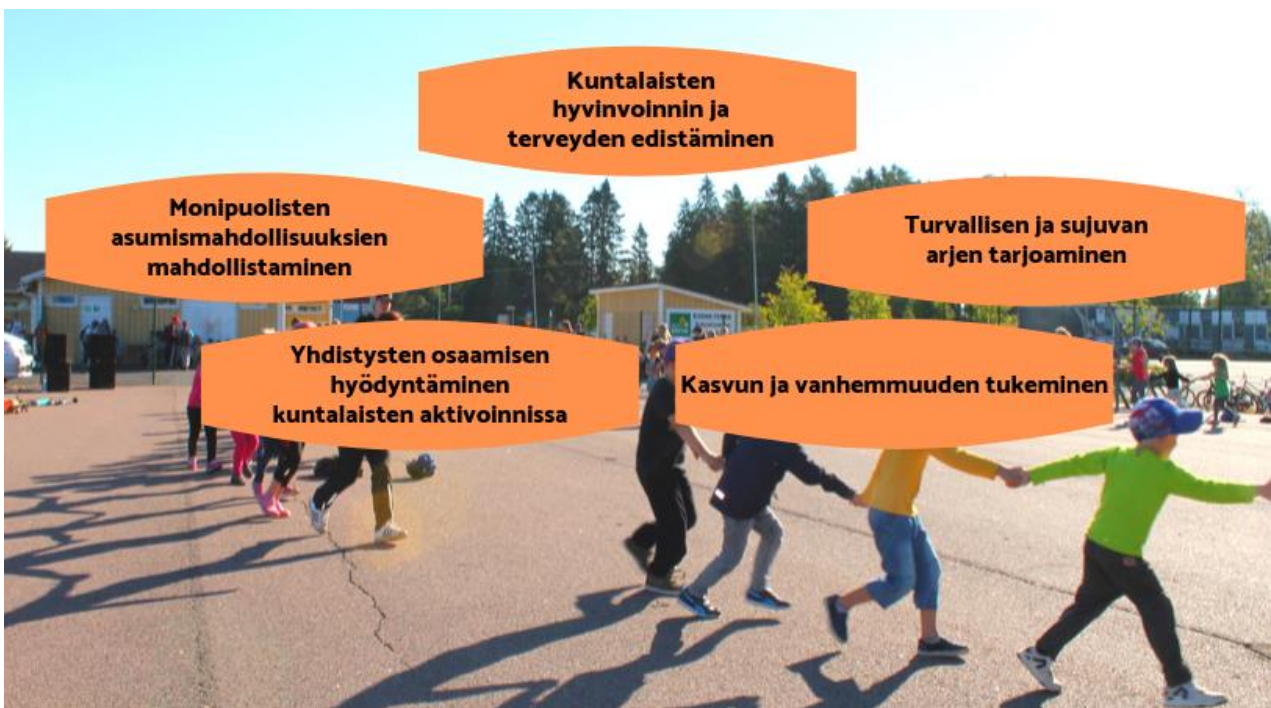
Eurajoen hyvinvointisuunnitelman painopistealueet vuosille 2017-2020 (kvalt 3/2018)

Eurajoen kunnanvaltuusto on hyväksynyt hyvinvointisuunnitelman painopistealueet kuntastrategian pohjalta vuosille 2017-2020 kokouksessaan 6.3.2018.