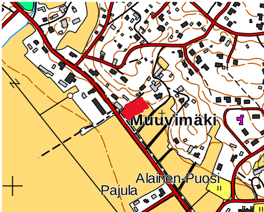
Kuva 1: Kaavamuutosalueen sijainti Luvian taajamassa.

Suunnittelualue sijoittuu Luvian taajaman kaakkoisosaan Muuvimäen eteläpuolelle Kirkkotien ja Löytynkujan risteyksen itäpuolelle.