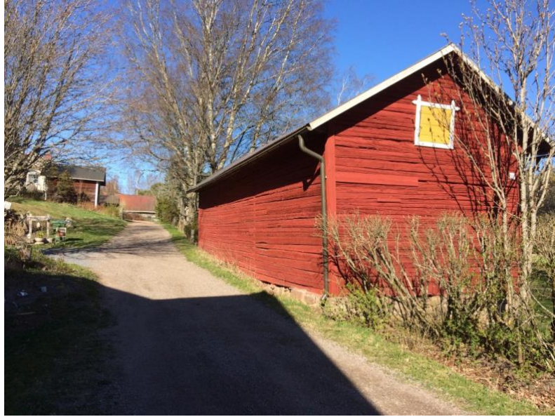
Kuva 6: Talousrakennus Löytynkujan puolelta