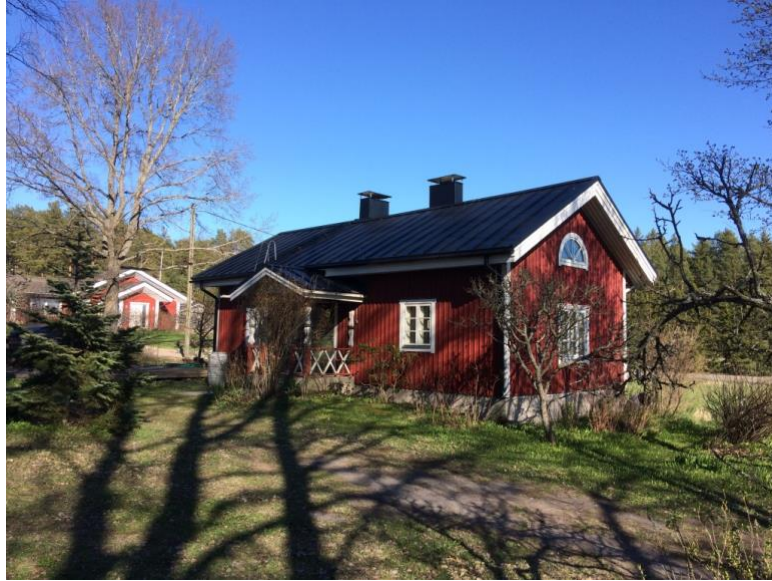
Kuva 8: Asuinrakennus.