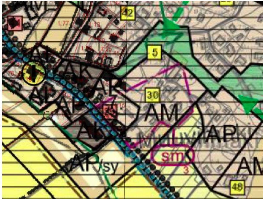
Kuva 4: Ote Luvian keskustan yleiskaavasta