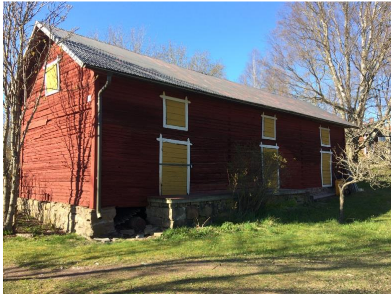
Kuva 7: Talousrakennus pihan puolelta