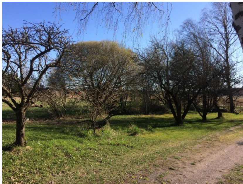
Kuva 2: Piha ja puutarhaa

Suunnittelualue on vanha asuinpaikka. Omakotitalon pihapiirissä on pihan ja istutusten lisäksi runsaasti hedelmäpuita sekä muita puita. Tontin itäosa on avointa niittyä.